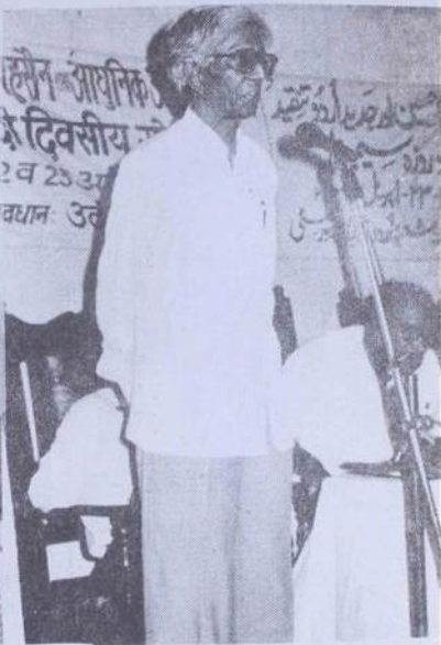
پروفیسر احمد لاری سابق صدر شعبہ اردو گور